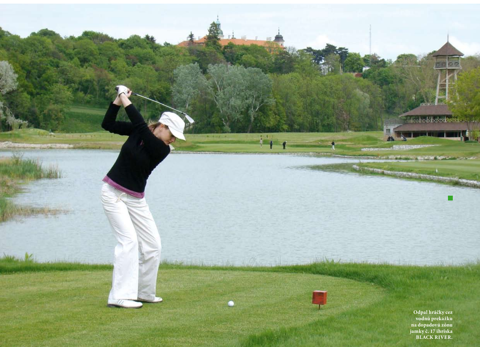
Odpal hráčky cez vodnú prekážku na dopadovú zónu jamky č. 17 ihriska BLACK RIVER.