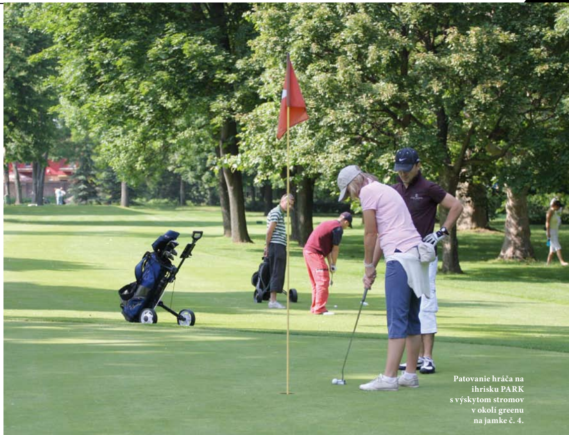
Patovanie hráča na ihrisku PARK s výskytom stromov v okolí greenu na jamke č. 4.

Osobne som sa presvedčil a odskúšal si, aké dobrodružstvo čaká na hráča, ktorý si myslí, že môže ihrisko BLACK RIVER pokoriť bez premyslenej stratégie hry. Mýlil som sa, ale výzva vo mne ostala o to väčšia. Keďže golf je hrou, kde si hráč po každom údere myslí, že ho môže zahrať nabudúce ešte lepšie, ostáva pre mňa ako aj pre ostatných hráčov a členov golfový areál Golf and Country Club Bratislava Bernolákovo nevyriešenou hádankou na dlhé roky. A môže sa stať aj vašou. Či už ste pravidelní golfoví hráči, alebo úplne na začiatku golfovej cesty. GCCB-B je správnym miestom s ideálnou kombináciou ihrísk a členstiev, kde môžete mať z golfu radosť a množstvo zážitkov na veľa rokov dopredu. Všetky informácie o GCCB-B nájdete na stránke www.golf.sk .