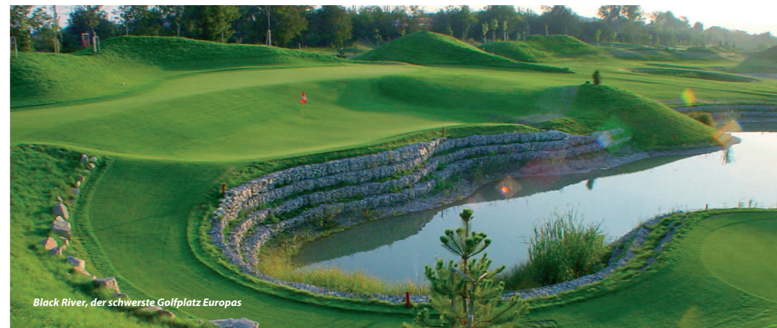
Black River, der schwerste Golfplatz Europas