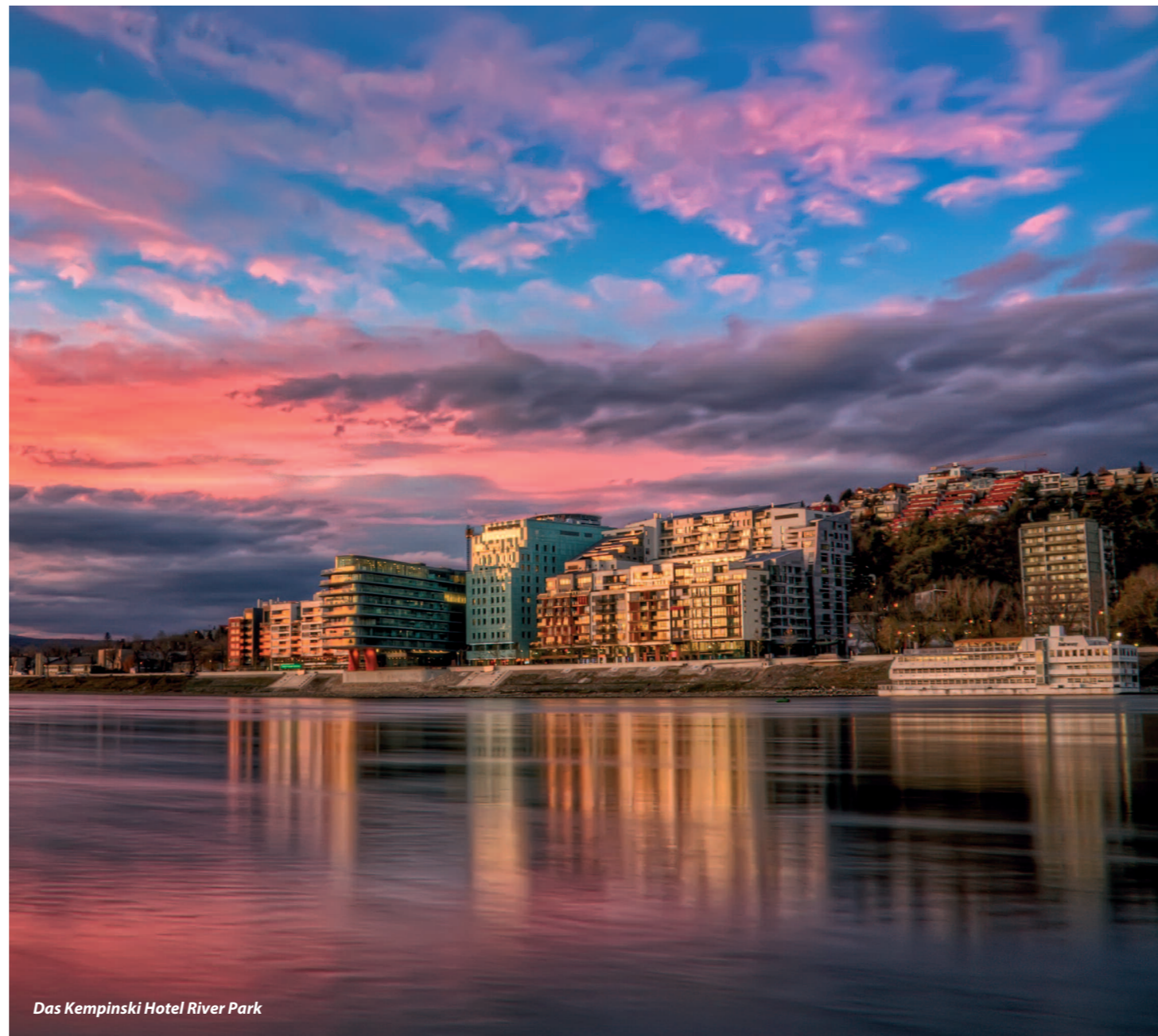
Das Kempinski Hotel River Park

Weitere Informationen unter www.kempinski.com/bratislava und www.golf.sk