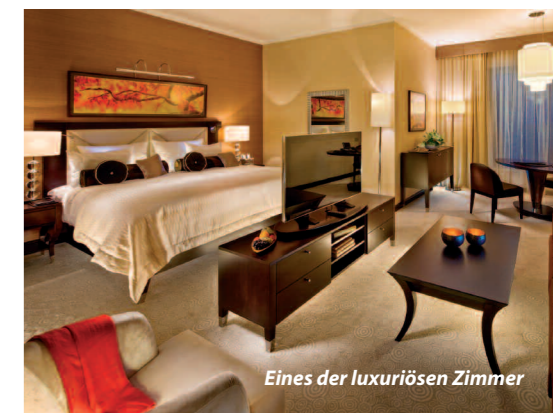
Eines der luxuriösen Zimmer