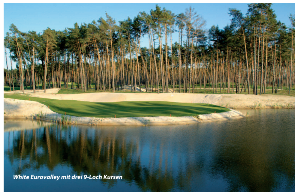
White Eurovalley mit drei 9-Loch Kursen